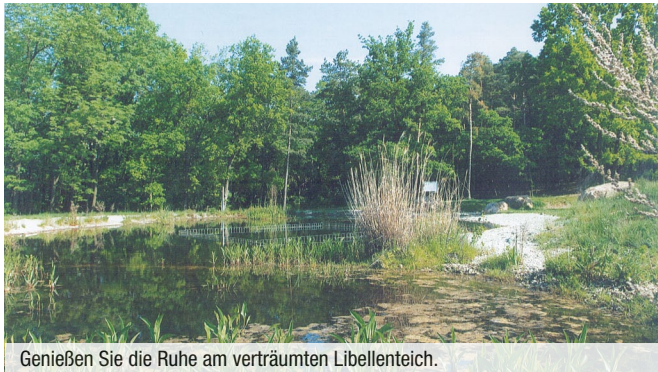
Genießen Sie die Ruhe am verträumten Libellenteich.

Von hier aus führt unser Weg entlang eines Steilabfalles zum Schleinzbach und dem Grenzweg Limberg - Oberdürnbach wieder zurück zum Ausgangspunkt.