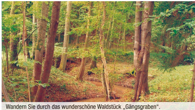
Wandern Sie durch das wunderschöne Waldstück „Gängsgraben“.